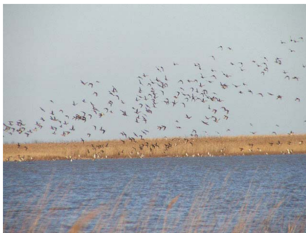
Slika 2. Slano Kopovo