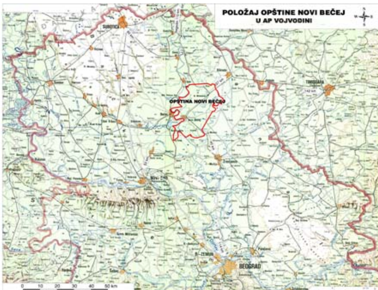
Karta 1. Položaj opštine Novi Bečej