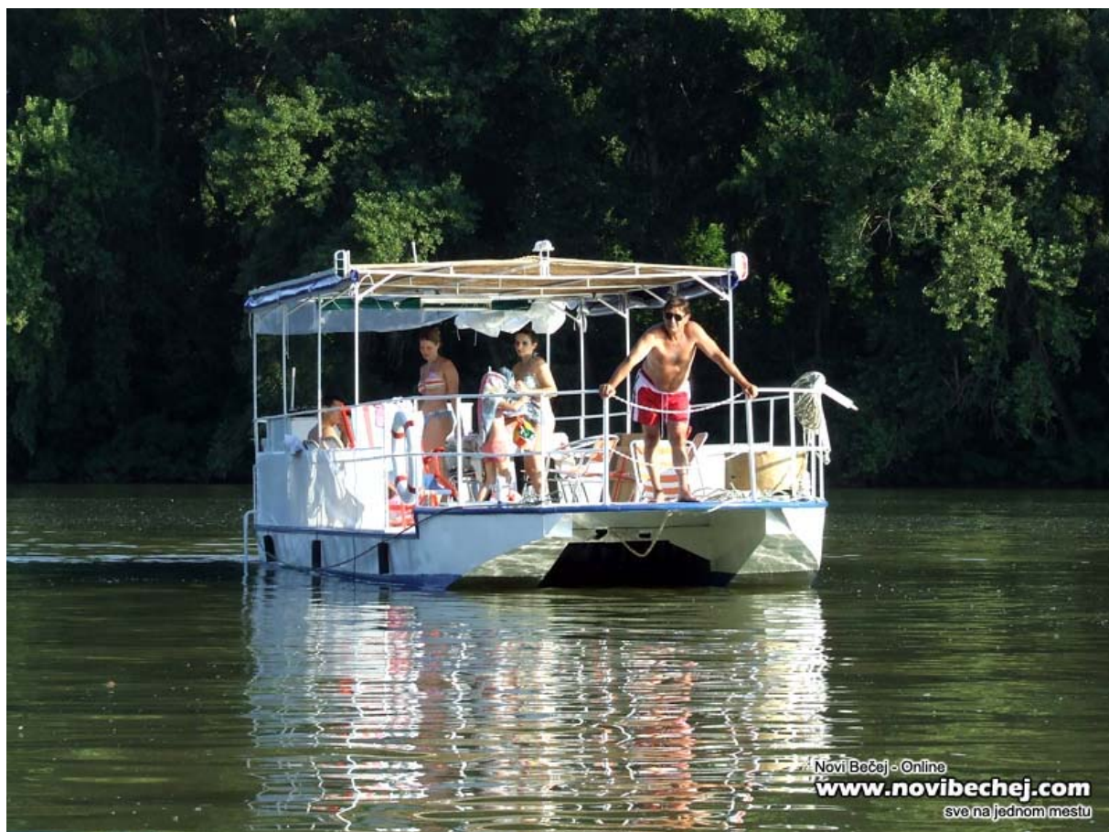
Slika 6. Brod na Tisi

Osnovna ograničenja i problemi područja planiranja u oblasti saobraćajne infrastrukture su u vezi sa pojedinim vidovima saobraćaja, a pre svega to su: