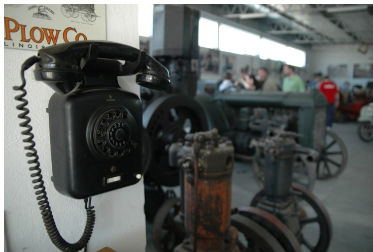
Slika 4. Muzej „Žeravica“

Muzej „Žeravica“ već funkcioniše kao muzejski prostor i eksponati koji su izloženi su predstavljeni na način prilagođen razgledanju posetilaca.