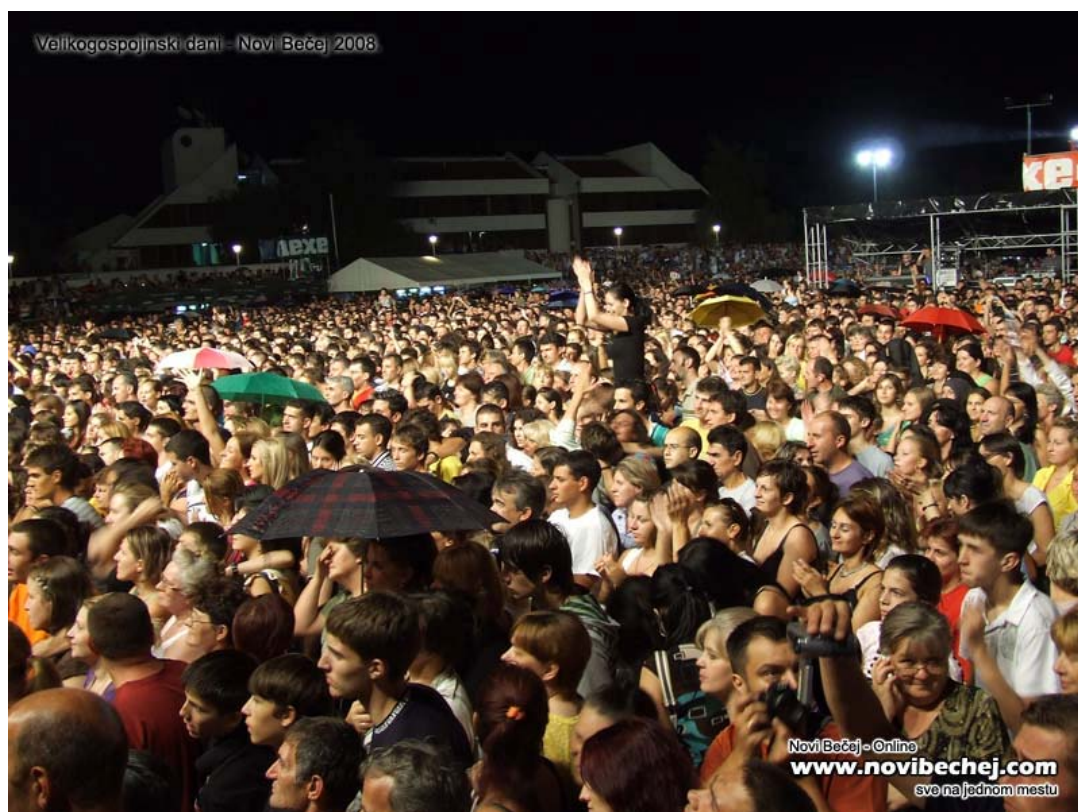
Slika 5. Velikogospojinski dani