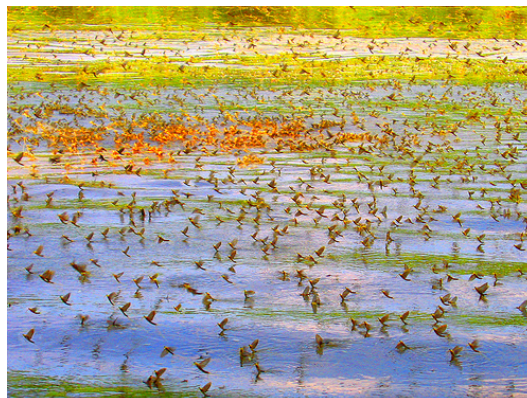
Slika 1. Cvetanje Tise

Tiski cvet je krilati insekt bele boje. Leptir vodenog cveta živi kratko vreme — po nekoliko sati, a larva u rečnom mulju i po nekoliko godina. Leptir izlazi na površinu vode u prvoj polovini juna i to u rojevima, pa je ne samo čitava površina vode pokrivena, već i sve priobalje.