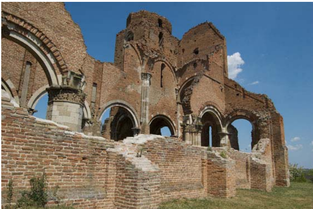
Slika 3. Arača