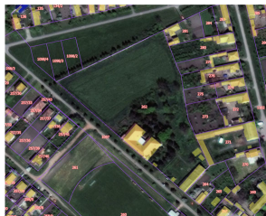
Слика бр. 2 Катастарска парцела 262 К.О. Бочар

Дворац је монументална, приземна грађевина, постављена на регулациону линију Просветне улице у Бочару. Основа је у облику ћириличног слова П, са дугачким дворишним крилима. На парцели су и помоћни, економски објекти, од којих је један већих димензија, постављен у самом доњем десном углу парцеле. Краћом страном правоугаоне основе излази на регулациону линију улице. Објекти се налазе на катастарској парцели број 262, К.О. Бочар, Општина НовиБечеј.